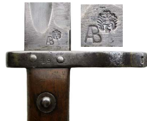
Stejný výrobce na bodáku pro krátkou pušku (Stutzenkarabiner). Bodák sloužil ještě v rakouské armádě v poválečném období...

... a předtím tvořil součást výzbroje rakouského 3. pěšího pluku