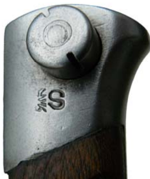
Nosec pochvy z ohýbané pásoviny od stejného výrobce