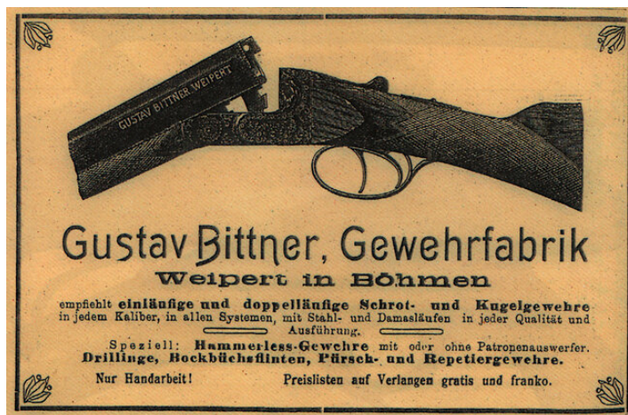
Reklamní leták firmy Gustav Bittner, Gewehrfabrik