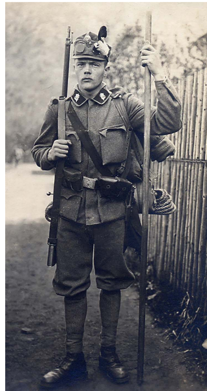
Typická fotografie před odchodem na frontu, mnohdy poslední podobizna