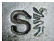
Hlavice jílce se značkou hlavního zbrojního skladu