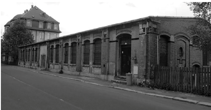
Puškařský závod Gustava Bittnera ve Vejpřtech, stav v roce 2011. ( http://www.weiperter-vorfahren.de )

Proslulý puškařský závod s pozdějším názvem Gustav Bittner, Gewehr- u. Stahlläufefabrik, Weipert in Böhmen založil v roce 1860 Emil Gustav Rupert Bittner (1843–1908) společně s bratrem Raimundem, jejichž puškařská dílna s malým počtem zaměstnanců původně sídlila v Jahnstrasse č. 97. Od roku 1886 nesla firma název Gustav &