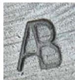
Ricasso nese signaturu AB