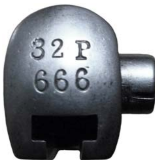
Exemplář měl v evidenci pěší pluk 32 „Gardský“ v Košicích s pořadovým číslem 666