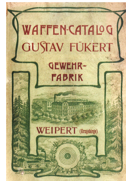
Katalog zbraní firmy Gustav Fükert, Gewehrfabrik ( www.boehmisches-erzgebirge.cz )

Třetím členem konsorcia se stala Továrna na zbraně Wenzel Morgenstern & Sohn, Gewehr-Fabrik, Weipert , založená v roce 1874 Wenzelem Morgensternem (1850–1936), která původně sídlila v Pochhausbergstrasse č. 99. V roce 1890 rozvoj firmy umožnil postavení moderní tovární budovy v č. 672. Díky zakázce štýrské zbrojovky na 250 000 spouští pro opakovačky Mannlicher M 1888 rozšířil Morgenstern výrobní zařízení továrny. Zmínky o založení výrobního konsorcia v roce 1889 právě za účelem plnění zakázek OEWG vede k domněnce, zda již tehdy nesestávalo ze stejných