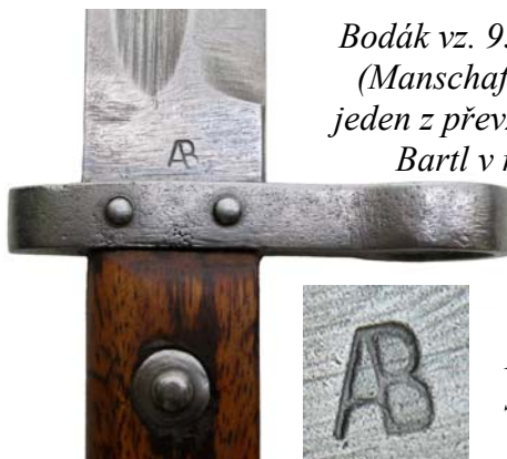
Bodák vz. 95 pro mužstvo (Manschaftsbajonette), jeden z převzatých u firmy Bartl v roce 1919

písmena AB. Napovídal by tomu nejen jejich častější výskyt u nás, ale také skutečnost, že takto značené kusy často nesou čs. přidělovací útvarové označení, případně značku některé z divizních zbrojnic. Kvalita jejich zpracování je rovněž velmi nízká.