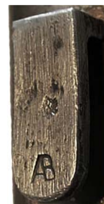
Hranatý nosec pochvy převzaté rakousko-uherskou armádou, vyrobený podle předválečného vzoru. Pozdější nosce byly kvůli zjednodušení výroby zhotoveny z ohýbané pásoviny. Výrobce AB.