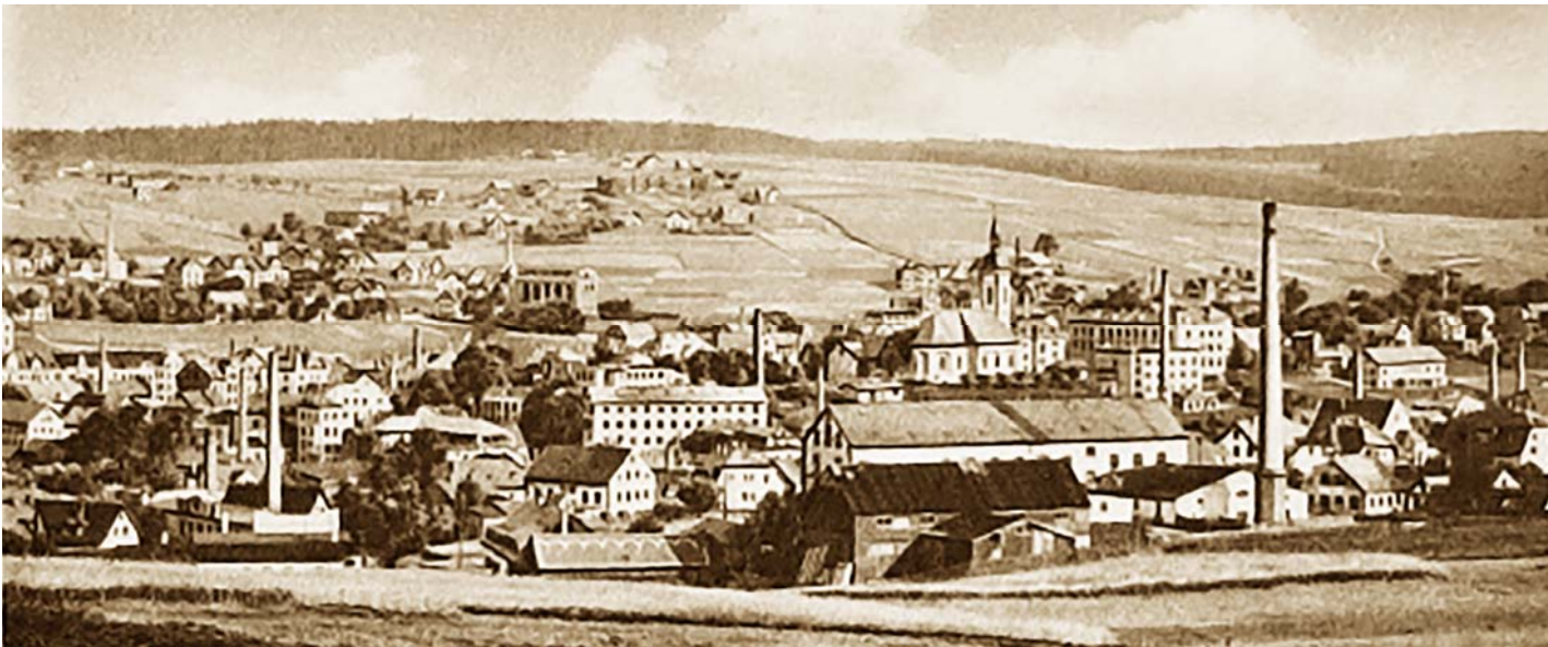
Průmyslové město Vejprty, rok 1926